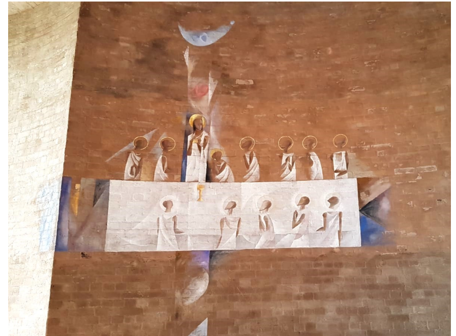
Altarbild in der Kirche „Zum Heiligsten Abendmahl“ in Schopfloch

Kirchenanzeiger und Nachrichten aus der Pfarrei 30.05.2021 - 04.07.2021 Ausgabe 06/2021