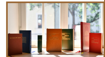
Liturgische Bücher - Foto: Julian Schmidt