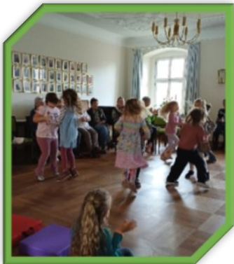
Ihr Team vom Haus der Kinder St. Magdalena

Der Besuch bereitete nicht nur den Seniorinnen und Senioren eine große Freude, sondern machte auch den Kindern viel Spaß. Die gemeinsame Zeit zeigte einmal mehr, wie schön Begegnungen zwischen Jung und Alt sein können.